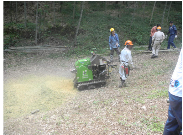
竹林整備作業の様子