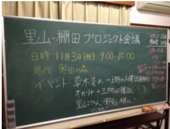
会議で使った黒板