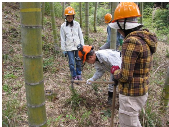
たけのこ掘りの指導