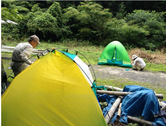
テント設営の様子