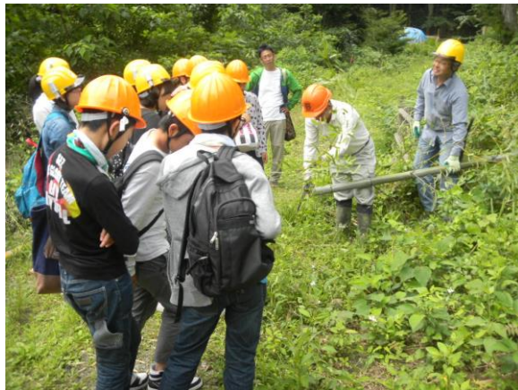
伐竹作業指導の様子

事前連絡が徹底しておらず、軍手無し・スカート・サンダル・半袖・半ズボンなど、作業にそぐわない装備の参加者もいた。トラスト及び林研から講師として7名が参加し、各グループを担当した。講師の指導により周囲の安全を十分確かめながら作業を行ったため、怪我もなく無事に終えることができた。