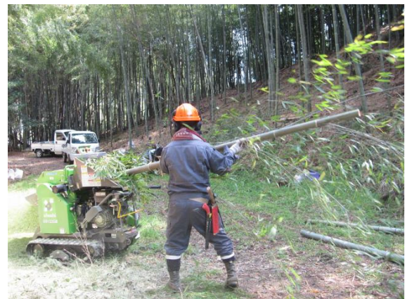
チップパーで竹を粉碎