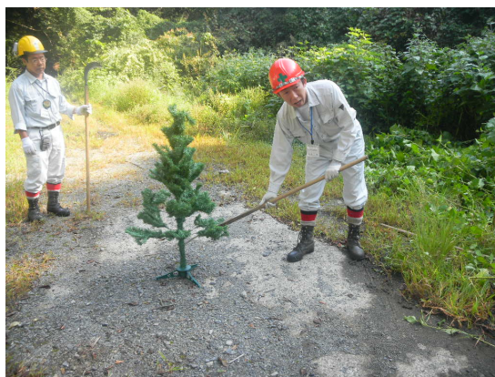
下草刈り講習の様子