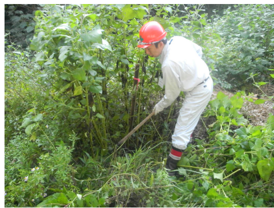
草刈り作業の様子