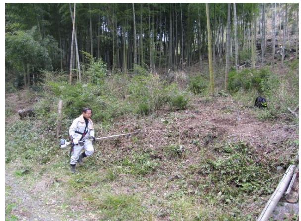
下草刈り作業の様子